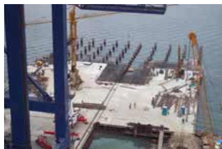
Muelle Sociedad Regional Portuaria de Cartagena (SRPC), Cartagena 2012