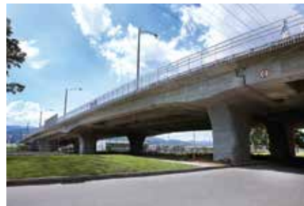
Puente Conexión Itagüí con Sabaneta Antioquia 2012