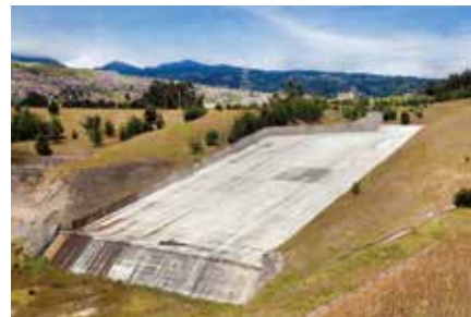
Presa Control de inundaciones Cantarrana, Bogotá 2007