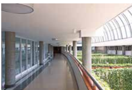
Remodelación Aeropuerto Olaya Herrera, Medellín 2010