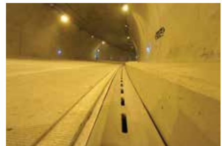
Doble Calzada Bogotá - Villavicencio, 2015. Sectores 3, 3A y 1A. 4.928 metros