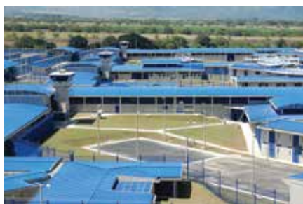
Centro Penitenciario La Picalaña Ibagué 2010