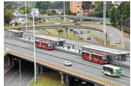
Intercambio Vial Av. Boyacá x Av. Suba (Obra Premiada), Bogotá 2005