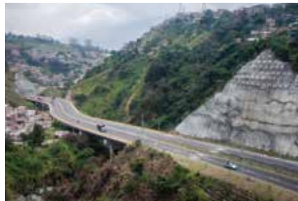
Puente La Iguaná Medellín 2015