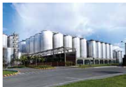
Cervecería Leona Tocancipá - Cundinamarca 1996