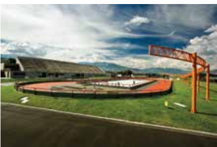
Parque María Luisa Calle Medellín 2009