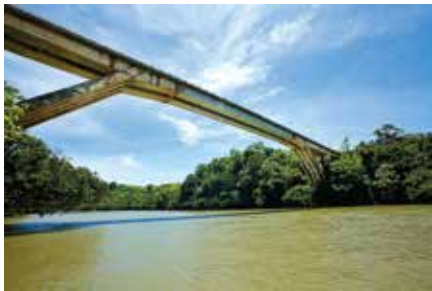
Puente sobre el Río Nare (Obra Premiada), Puerto Nare - Antioquia 1987