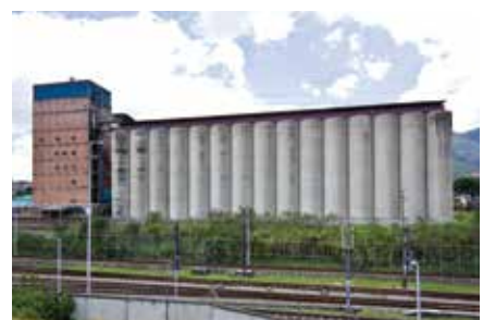
Silos Federación Nacional de Cafeteros Medellín 1967