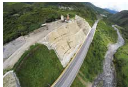
Doble Calzada Bogotá - Villavicencio, 2015