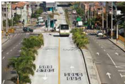
Adecuación de la Calle Barranquilla al Sistema Metroplus, Medellín 2011