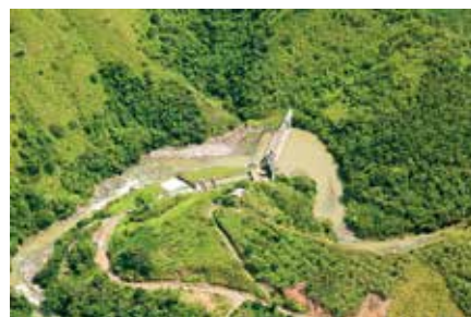
CH La Herradura y La Vuelta Frontino - Antioquia 2004