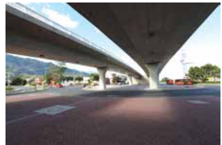
Intercambio Ciudad Musical Ibagué 2012