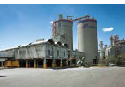
Planta CEMEX Ibagué 1996