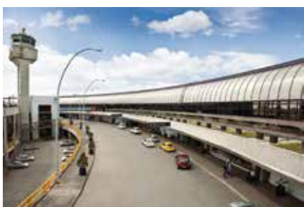
Aeropuerto José María Córdova Antioquia 1985, 2010 y 2017