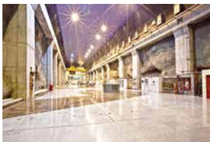
Central Hidroeléctrica Porce III Porce - Antioquia 2012