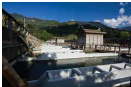
Planta de Tratamiento La Ayurá Medellín 1968