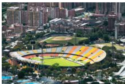
Tribuna Oriental Estadio Atanasio Girardot, Medellín 1976