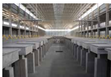
Planta Vidrio Andino Soacha - Cundinamarca 2009