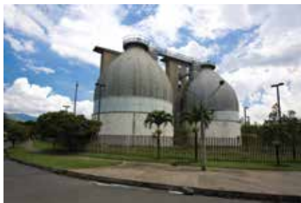
Biodigestores PTAR San Fernando Itagüí - Antioquia 1999