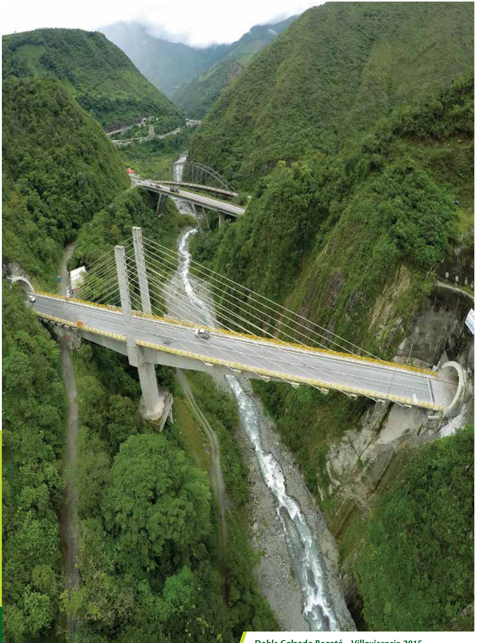
Doble Calzada Bogotá - Villavicencio 2015