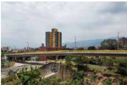
Intercambio Vial Carrera 80 Medellín 2013