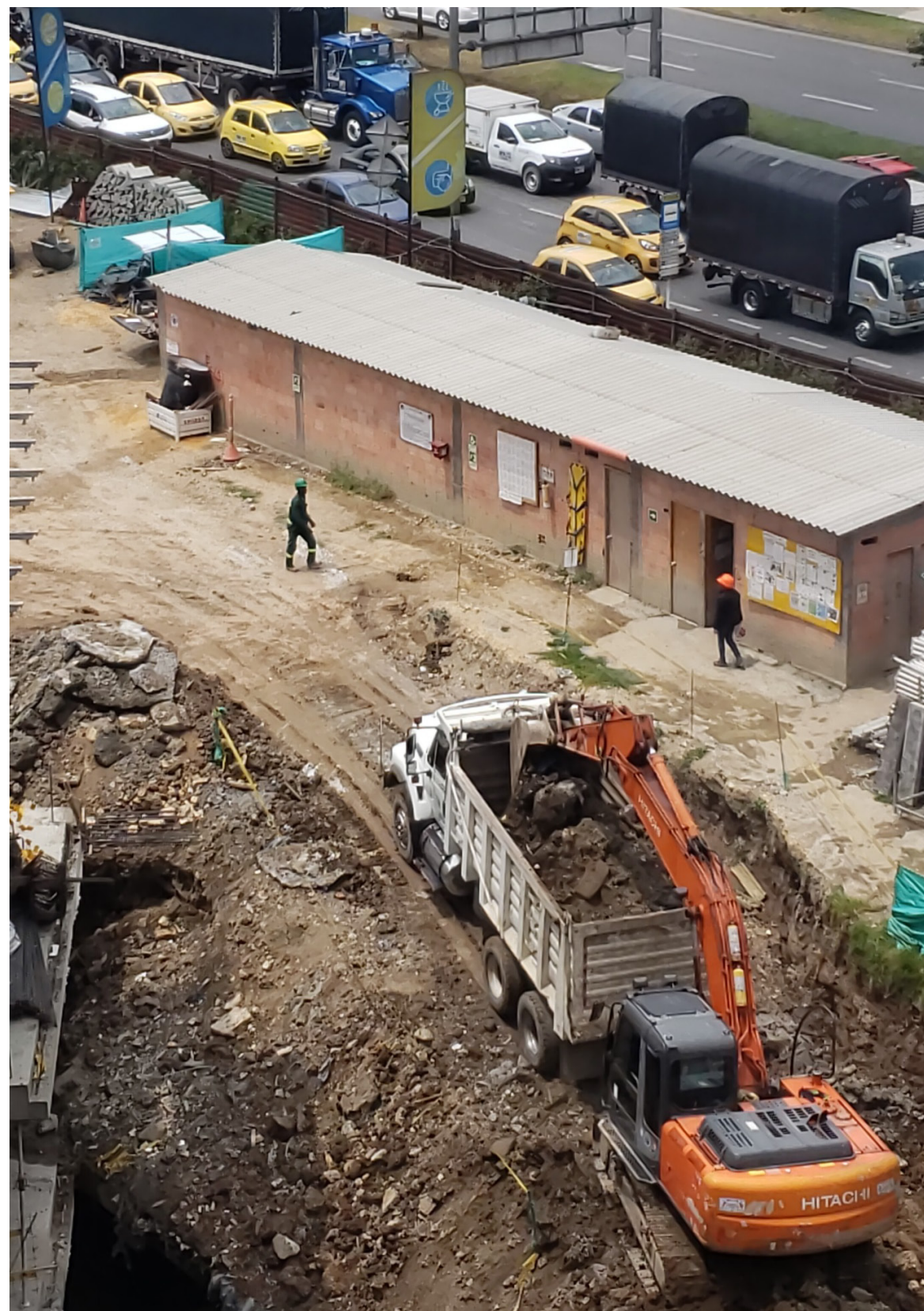
Excavación zona A8 cimentación