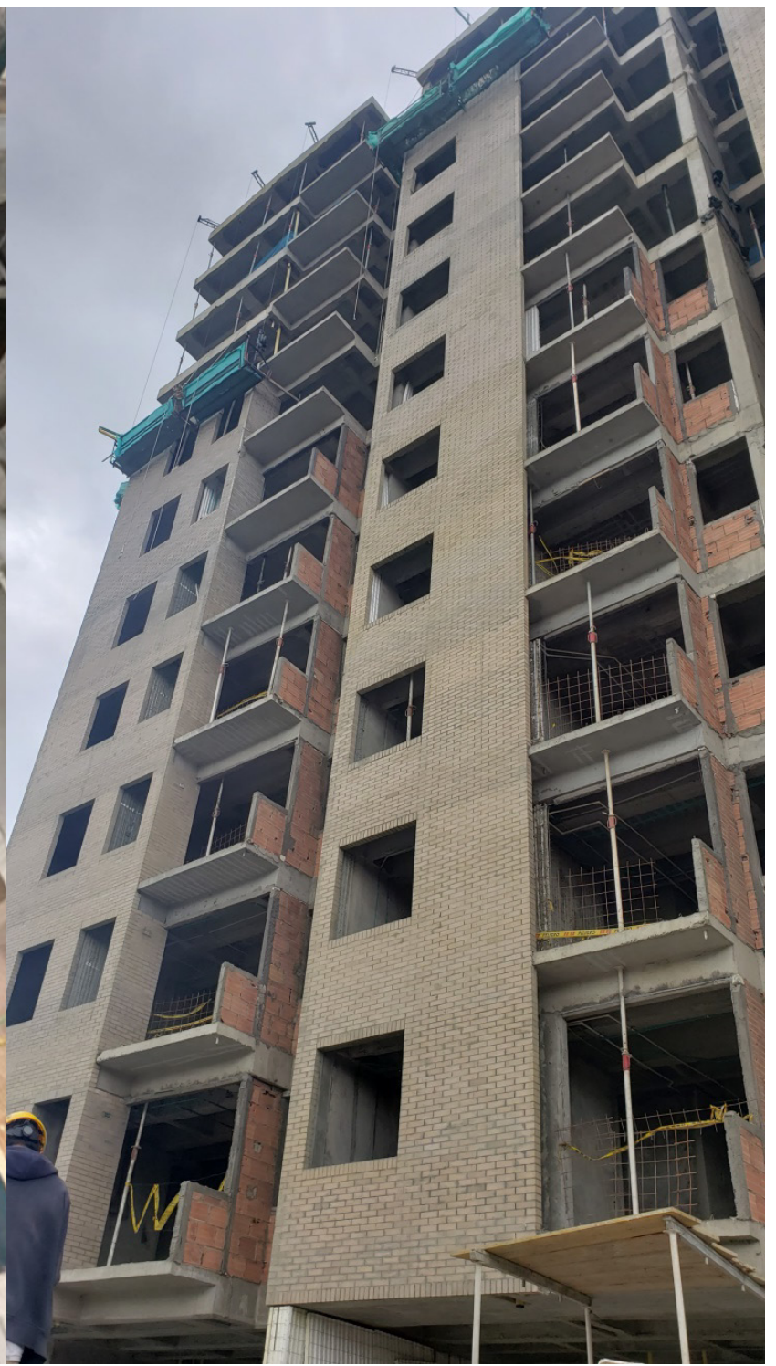
Fachada norte torre 1