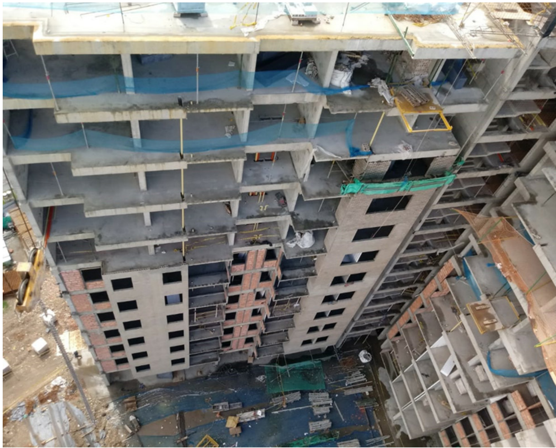
Fachada sur torre 1