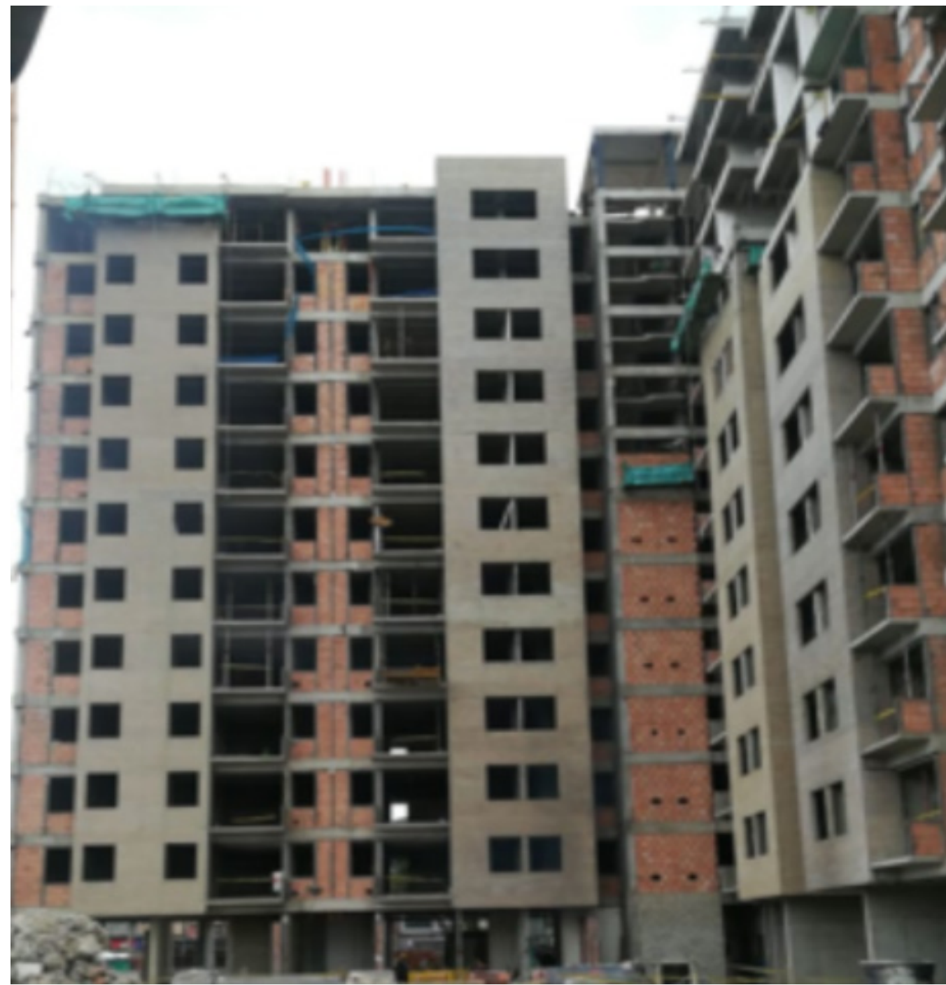
Fachada sur torre 1