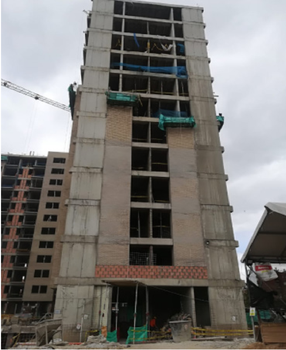
Fachada sur torre 1 - 2