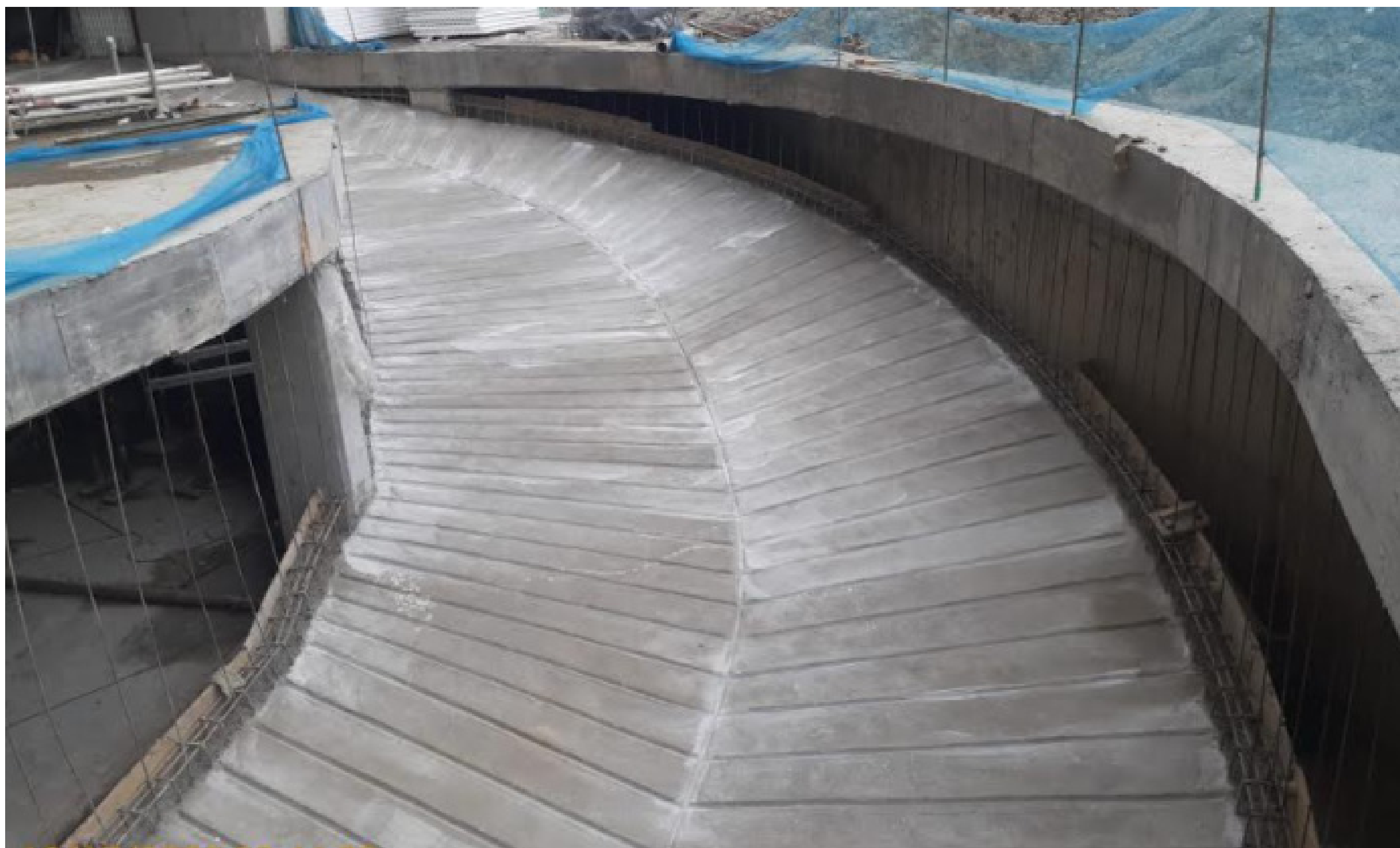
Estructura de rampa