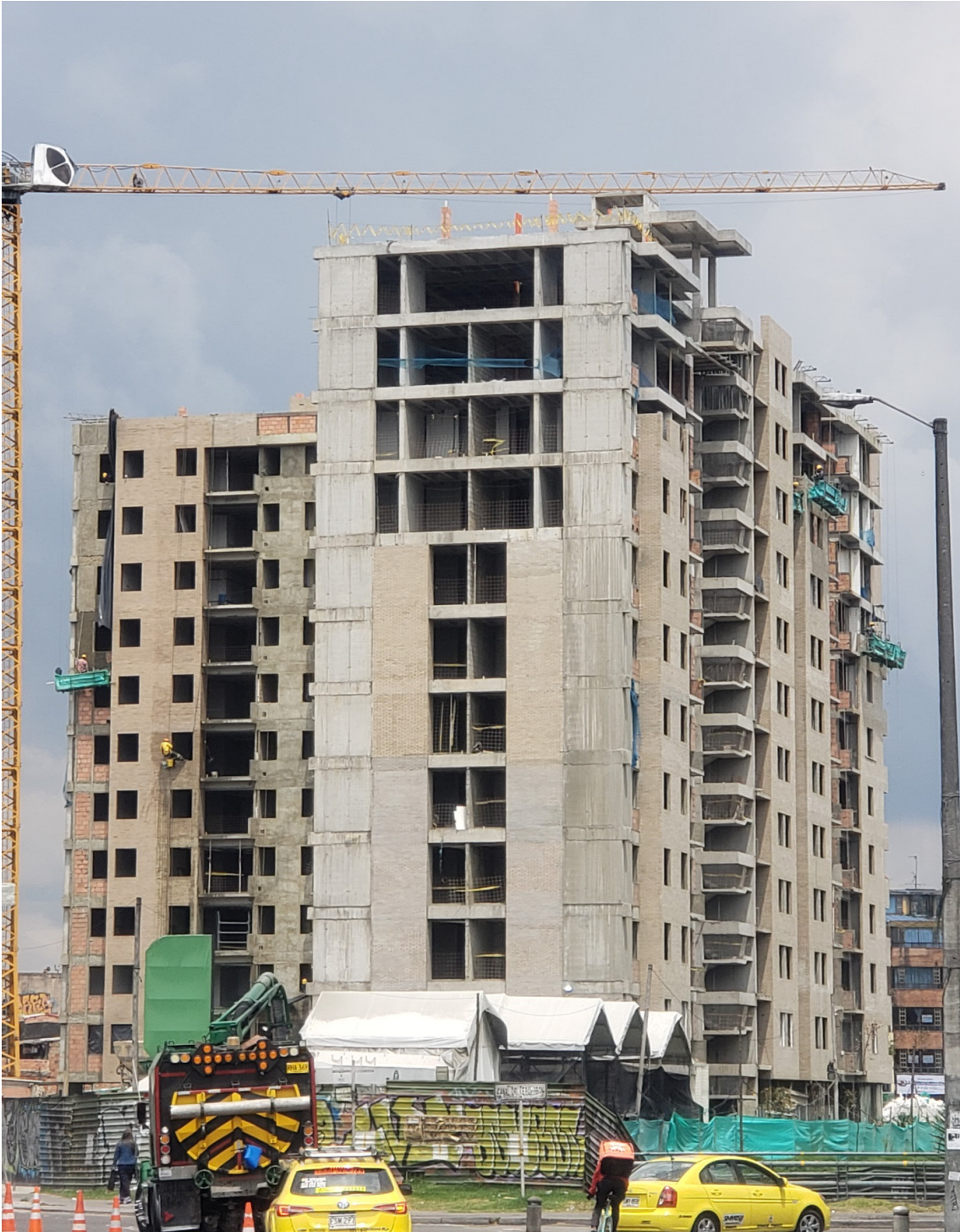
Fachada sur torre 1 - 2