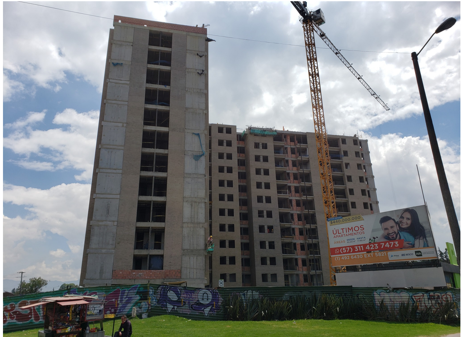
Fachada occidental torre 1 - 2